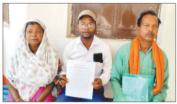
थाने में बैठे शिकायतकर्ता।

टिपण्णी किया था, जिसके बाद समूचे प्रदेश में महंत का पुतला दहन किया गया। इस क्रम में जशपुर शहर