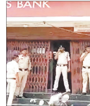
डकैती को सजा दिलाने अहम साबित होगी रिपोर्ट

पिछले साल माह सितंबर में शहर में दिनदहाड़े हुए एक्सिस बैंक डकैती में पकड़े गए आरोपियों का कोतवाली पुलिस द्वारा गेट पैटर्न एनालिसिस जांच कराया गया, जिसकी रिपोर्ट डायरेक्टर ऑफ फॉरेंसिक साइंस गुजरात से प्राप्त हुई है।