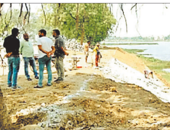
75 लाख फुटपाथ निर्माण 13 लाख 64 हजार, लाइटिंग 18 लाख 50 हजार के साथ ही साथ अन्य कार्य सम्पलित है।

सारंगढ़ के सबसे बड़े मुड़ा तालाब के सौंदर्यीकरण को लेकर लंबे समय से चली आए रही कवायद अब मूर्त रूप लेने की ओर अग्रसर है। यदि सब कुछ योजनाओं के अनुरूप हुआ तो इसी साल बरसात बाद यह तालाब नए और आकर्षक स्वरूप में नजर आने लगेगा।