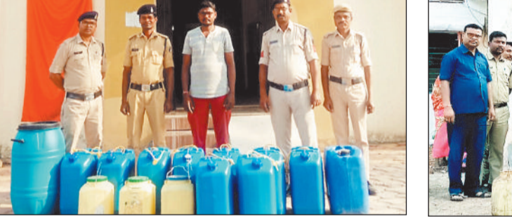
जब शराब व पुलिस गिरफ्त में आरोगी।