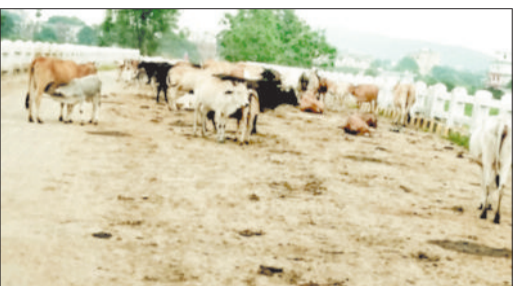
मेन रोड पर विचरण करते मवेशी।