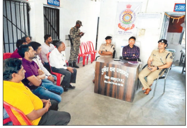
होटल व ढाबा संचालकों की बैठक लेते एसपी।