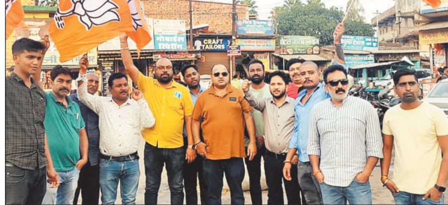
पुतला दहन करने के बाद नारेबाजी करते भाजपाई।

पीएम नरेंद्र मोदी के खिलाफ विवादित बयान देने वाले कांग्रेसी नेता चरणदास महंत का भाजपा कार्यकर्ताओं ने पुतला दहन कर मुर्दाबाद का नारे न लगाया। वि वा दि त बयान का घोर निन्दा करते हुवे भाजपा कार्यकर्ताओं ने महंत को माफी मांगने का बात भी कहा। ज्ञात हो कि गत दिनों कांग्रेस के वरिष्ठ प्रदेश नेता और नेता प्रतिपक्ष चरणदास महंत ने पीएम नरेंद्र मोदी पर विवादित