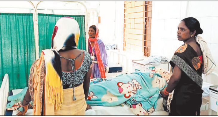
अस्तपताल में उपस्थित परिजन।