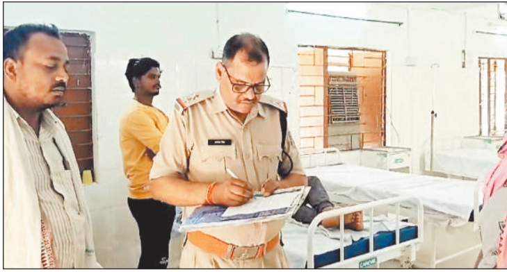
प्रकरण की जांच करती पुलिस।

हरिभूमि न्यूज ▶▶ कोतबा जशपुर जिले में मोबाइल फोन को लेकर अब तक दर्जनों घटनाएं सामने आ चुकी हैं। ज्यादातर इसमें नाबालिक बच्चों को उनके कर्तव्यों का बोध कराना उनके माता-पिता के लिये चुनौती साबित हो रही है। और इन्हीं बातों से नाराज होकर नाबालिग बच्चों गुस्से में आकर मौत को गले लगा लेते हैं।