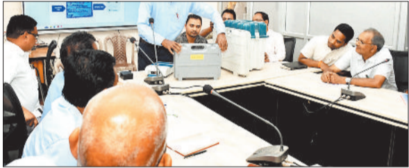
सामग्री का वितरण किया जाएगा, जिसे प्राप्त होने पर चेकलिस्ट से मिलान करना होगा।